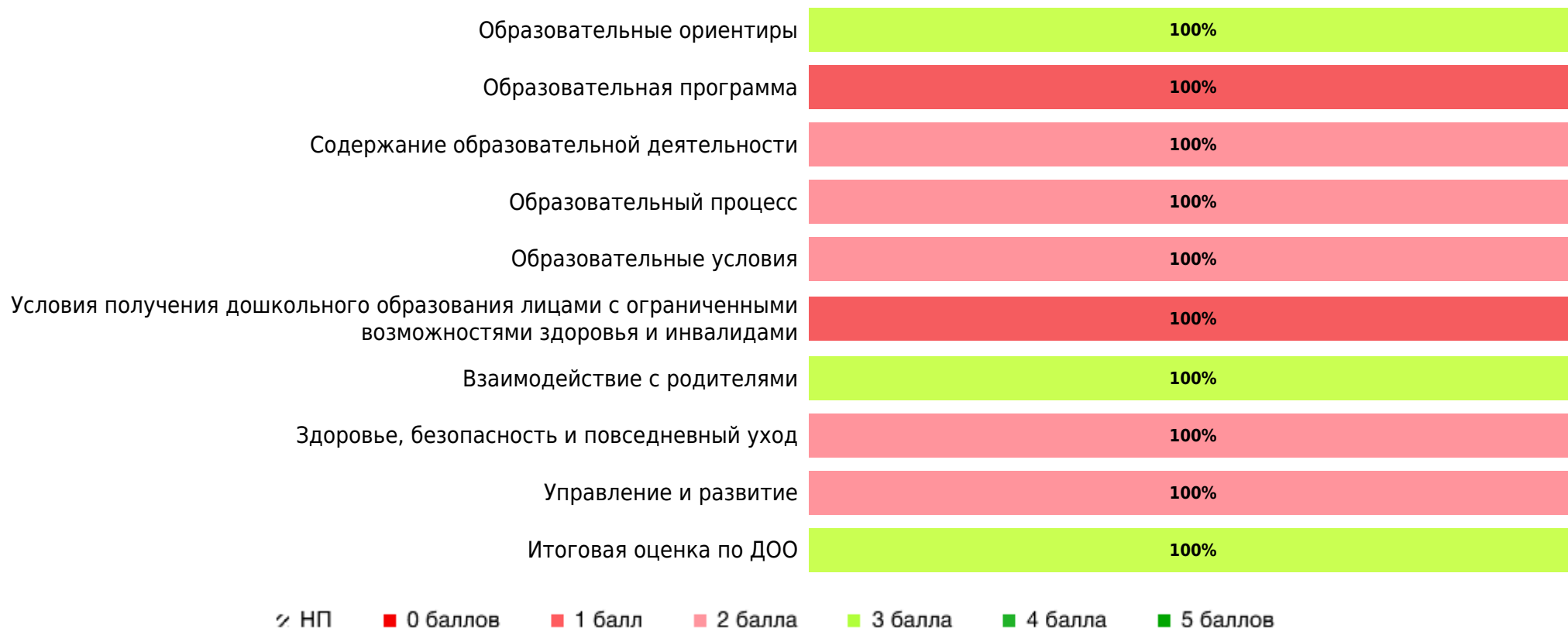
Доли ДОО с разными баллами у педагогов